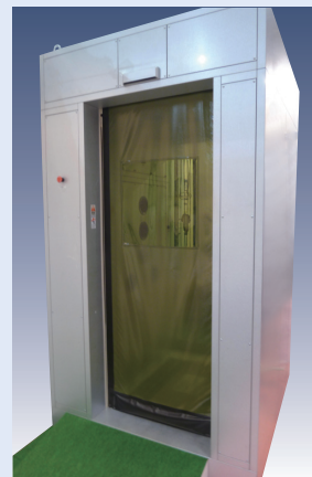
シートシャッター