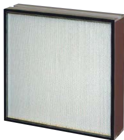
内蔵されているHEPAフィルタ